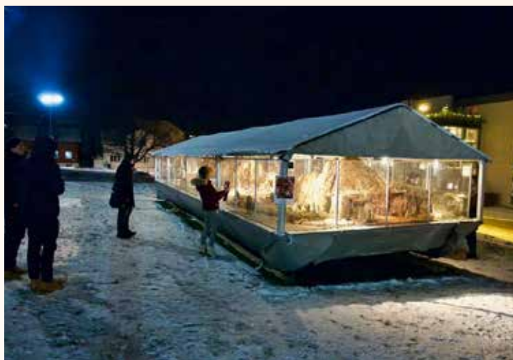
Julekrybben etter åpningen 1. desember 2021.

Det ligger en stor arbeidsinnsats bak å få satt overbygg og figurer opp til advent og ta det hele ned i Februar. En større gruppe mennesker bidrar frivillig med sin arbeidsinnsats, fagkunnskap og ressurser for å få dette til hvert år.