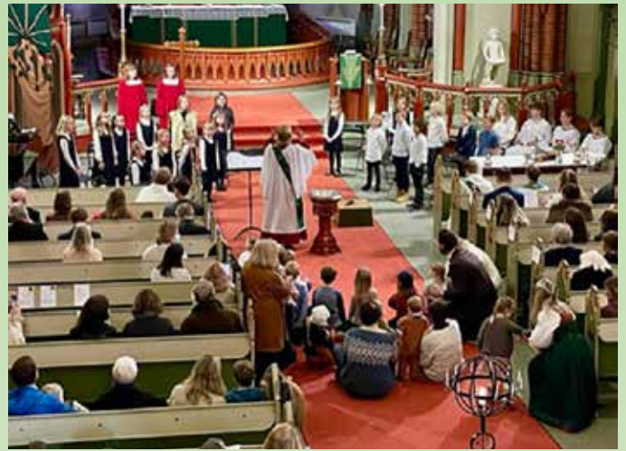
Aspirantene fremførte syngespillet Mannen i treet.