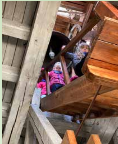
Tårnagenter på beøk i tårnet.