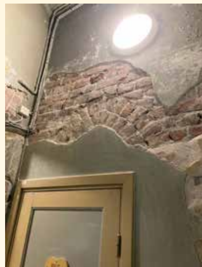
Gangen bak kirkens sakristi har vært gjenstand for store endringer gjennom tidende. Ved nedpussing av muren på veggene kom interessante detaljer til syne. Her ser man litt av hvelvingen i det som sannsynligvis har vært et vindu i den opprinnelige ytterveggen. Bak denne veggen er det i dag toalettrom og prestesakristi, påbygget på 1970-tallet.

Samtidig jobbes det med å planlegge fullføring av installasjon av sprinkelanlegg i Bragernes Kirke. Dette er en etterlengtet og meget viktig utbedring for brannsikkerheten i kirkebygget vårt.