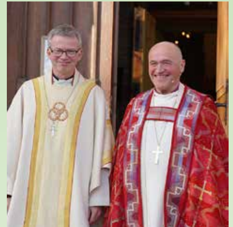
Ny prost Øystein Magelssen sammen med biskop Jan Otto Myrseth.