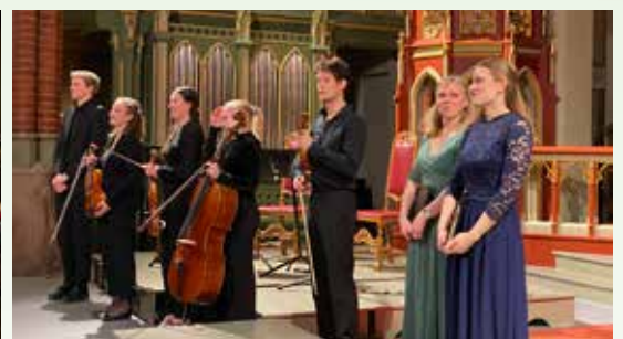
Fremføring av Pergolesis Stabat Mater.