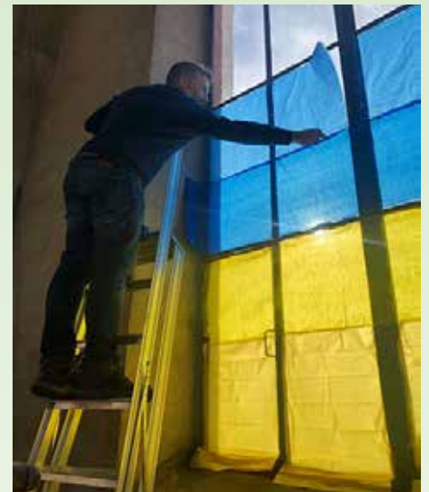
Ukrainas flagg i tårnet - i solidaritet med det ukrainske folk.