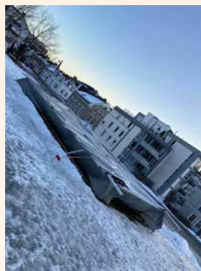
Etter uværet Gyda sine herjinger 14. januar 2022.

Om du ønsker å bidra praktisk kan du kontakt oss på e-post ms895@kirken.no , via våre sider på sosiale medier eller menighetskontoret (kontaktinfo bak i bladet)