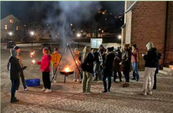
Grilling utenfor kirken under Lys Våken.