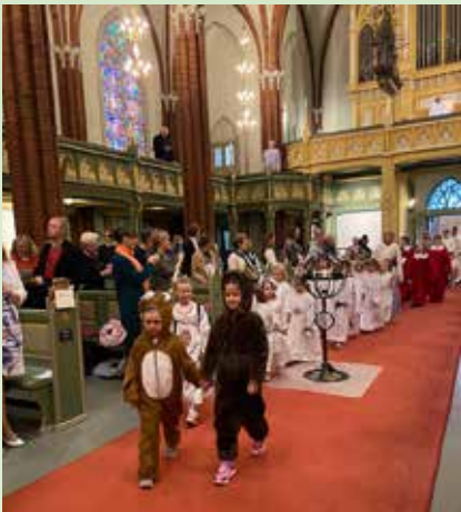
Familiemesse på påskeoktaven, der Minores fremførte syngespillet Skapelsen.