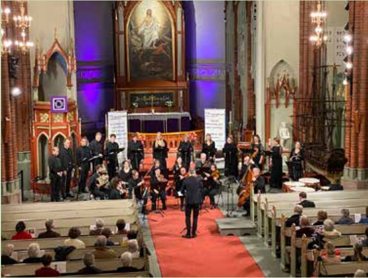
Bragernes kirkes solistensemble og orkester fremførte Brahms Ein deutsches Requiem under Halvorsenfestivalen.