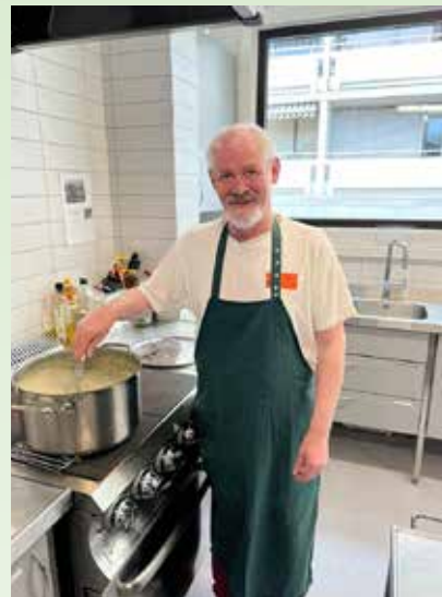
God medhjelper på kjøkkenet.