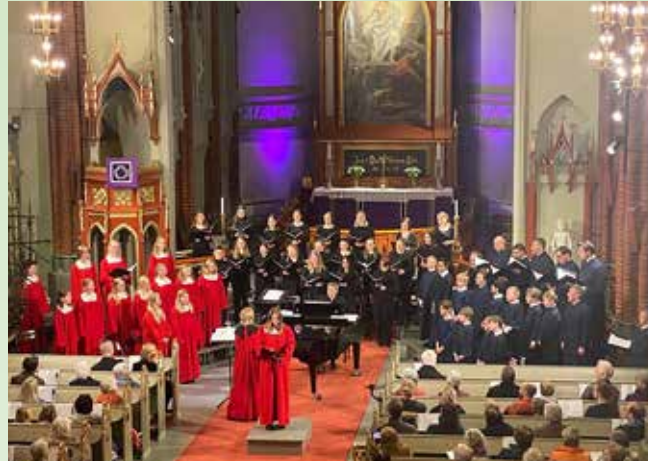
Endelig kunne korene ha vårkonsert med urfremføring av hele Te Deum Laudamus av Jørn Fevang.